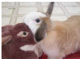
CAMEL &amp; LAPIN JOUET