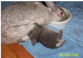
SUNNY &amp; MAMAN

Cadbury a été adopté par une gentille famille et tient compagnie à un autre mâle stérilisé. Sunny et Timmy , deux des bébés de Crystal , sont maintenant les lapins favoris de deux jeunes couples. Ruby , notre lapin le plus âgé a été adopté pour remplacer l'ami de Gavin qui venait de mourir. Kanu , le lapin trouvé errant au Club de canoë de Pointe-Claire a été rescapé et sa maman temporaire l'aime tellement qu'elle espère le garder. Fluff Daddy avait une maladie appelée torticolis, ou cou tordu. C'est une infection de l'oreille interne qui peut causer la mort si elle n'est pas traitée rapidement. Il a pris du mieux immédiatement et, grâce à son charmant caractère, a trouvé un nouveau foyer très rapidement. Joey a été trouvé abandonné dans le bois, dans une cage remplie d'eau de pluie. Il était transi de froid et terrifié. Quel sort horrible ! Après avoir été séché et réchauffé, il a été adopté le même jour. La chance a enfin souri au petit Joey.